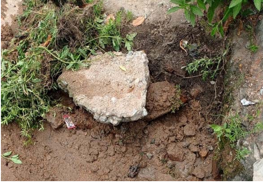
లీకేజీ రిపేర్ చేయమంటే? "కుళాయి బండ్" చెప్పాలి. సారూ! రేణిగుంట ఉత్తేజం మే 12.

రేణిగుంట పంచాయతీ పాంచాలి నగర్ ఐదవ వీధిలో 'నీళ్ల కొళాయి లీకేజీ' తక్షణమే మరమ్మత్తు చేసే ప్రజల సౌకర్యార్థం కొరకు నీళ్లు వచ్చే విధంగా పబ్లిక్ కుళాయి రిపేర్ చేయాలని రేణిగుంట సిపిఎం పార్టీ ప్రాంతీయ కమిటీ కన్వీనర్ కొండ్రెడ్డి హరినాథ్ మంగళవారం నాడు పత్రిక ప్రకటన ద్వారా రేణిగుంట పంచాయతీ కార్యదర్శిని డిమాండ్ చేశారు. ఈ సమస్య పైన 1100 నెంబర్ కు మే 9వ తేదీన కాలీ చేసి ఫిర్యాదు చేయడంతో 30 రోజుల్లో గ్రామపంచాయతీ అధికారులు వచ్చి సమస్య పరిష్కరించడం జరుగుతుందని కాలీ సెంటర్ విభాగం తెలియపరచడం దుర్భాగమని, అత్యవసర సేవల్లో 24 గంటల పబ్లిక్ కుళాయి కూడా ఒకటని.. అన్ని విధాల పనులు చెల్లించే ప్రజలకు నీళ్ల సౌకర్యం కల్పించడం రేణిగుంట గ్రామపంచాయతీ అధికారుల బాధ్యత అని గుర్తు చేశారు. లీకేజీ అరికట్టడం అంటే? ఈరోజు పంచాయతీ వాలర్ సిబ్బందిని పంపించి కుళాయి బండ్ చేయడం కాదని తక్షణమే కుళాయి రిపేర్ చేసి నీళ్లు వచ్చే విధంగా చేయాలని స్థానిక ప్రజలు కోరుతున్నారని తెలిపారు.