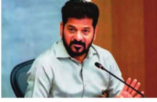
సున్నితమైనది కావడంతో దర్మాస్తును మహిళా ఐపీఎస్ అధికారిణి పర్యవేక్షణలో కొనసాగించాలని డిజిపీ నిర్ణయించారు. బాధితురాలు బాలిక కావడం, ఈ కేసులో ఉన్న ఆరోపణలు తీవ్రత దృష్ట్యా విచారణలో ఎలాంటి లోపాలు చోటుచేసుకోకుండా జాగ్రత్తలు తీసుకుంటున్నారు. సిట్ బృందం ఇప్పటికే కేసుకు సంబంధించిన ఆధారాలను సేకరించే పనిని ప్రారంభించినట్లు సమాచారం. పోలీసులు బాలిక స్టేషన్లోను చట్టపరమైన నిబంధనల ప్రకారం రికార్డ్ చేశారు. ఈ ప్రకటన ఆధారంగా మరిన్ని అంశాలను వెలికి తీసేందుకు అధికారులు ప్రయత్నిస్తున్నారు. విచారణలో భాగంగా సీసీడీఓ ఫుటేజీలు, కాలే డేటా, డిజిటల్ ఆధారాలు కూడా పరిశీలించే అవకాశముంది. ఈ ఘటనపై హైదరాబాద్ పరిధిలోని పేట్ బహిరాబాద్ పోలీస్ స్టేషన్లో భగీరథ్ పై కేసు నమోదు చేశారు. బాలిక ఫిర్యాదు, ప్రాథమిక ఆధారాల ఆధారంగా పోలీసులు కేసు నమోదు చేసి దర్మాస్తు చేపట్టారు. ఈ కేసు వెలుగులోకి వచ్చిన తర్వాత రాష్ట్రవ్యాప్తంగా రాజకీయ ప్రకంపనలు మొదలయ్యాయి. పోలీసులు పోక్సో చట్టం సహా పలు సెక్షన్ల కింద కేసు నమోదు చేసినట్లు సమాచారం. బాలికకు సంబంధించిన కేసు కావడంతో చట్టపరమైన పరిణయలను అత్యంత జాగ్రత్తగా అమలు చేస్తున్నారు.

హైదరాబాద్, మే 11: కేంద్ర మంత్రి బండి సంజయ్ కుమారుడు బండి భగీరథ్ కేసుపై సీఎం రేవంత్ రెడ్డి సీలయస్ అయ్యారు. భగీరథ్ పై పేట్ బహిరాబాద్ పోలీస్ స్టేషన్లో నమోదైన కేసుపైన తక్షణమే విచారణ మొదలుపెట్టాలని డిజిపీ సీఎం ఆనంద్ ను సీఎం ఆదేశించారు. మే 8న ఫిర్యాదు వస్తే ఇప్పటి వరకు ఎందుకు చర్యలు తీసుకోలేదని డిజిపీని ముఖ్యమంత్రి ప్రశ్నించారు. కేసు వివరాలను సీఎంకు డిజిపీ వివరించారు. ప్రధాన మంత్రి వాడి హైదరాబాద్ పర్యటన నేపథ్యంలో పోలీస్ సిబ్బంది అంతా భగీరథ్ ఏర్పాట్లలో నిమగ్నమయ్యారని తెలియజేశారు. కేసు సమగ్ర విచారణ కోసం ప్రత్యేక టీఎంఎస్ ఏర్పాటు చేయాలని డిజిపీ ఆనంద్ కు సీఎం రేవంత్ రెడ్డి ఆదేశాలు జారీ చేశారు. బండి భగీరథ్ పై ఈనెల 8న పేట్ బహిరాబాద్ పోలీస్ స్టేషన్లో ఓ ఫిర్యాదు వచ్చింది. తనను భగీరథ్ వేధిస్తున్నారని, పోక్సో కింద కేసు నమోదు చేయాలని ఓ మైసూర్ పోలీసులకు ఫిర్యాదు చేసింది. ఇప్పటి వరకు భగీరథ్ పై పోలీసు అధికారులు ఎలాంటి చర్యలు తీసుకోలేదని రేవంత్తో పాటు ఎఫ్ బిఆర్ కూడా నమోదు చేయనట్లు తెలుస్తోంది. ఈ అంశం తెలంగాణ వ్యాప్తంగా చర్చనీయాంశంగా మారింది. కేంద్ర మంత్రి కుమారుడిని ప్రభుత్వమే కాపాడుకోవడంలా ప్రతిపక్షాలు విమర్శలు గుప్పిస్తున్న పరిస్థితి నెలకొంది. తెలంగాణ రాజకీయాల్లో సంచలనం రేపిన కేంద్రమంత్రి బండి సంజయ్ కుమారుడి కేసులో ప్రభుత్వం కీలక అడుగు వేసింది. ఈ కేసును సమగ్రంగా విచారించేందుకు ప్రత్యేక దర్మాస్తు బృందం (సిట్) ఏర్పాటు చేస్తూ తెలంగాణ డిజిపీ సీఎం ఆనంద్ ఆదేశాలు జారీ చేశారు. ముఖ్యమంత్రి రేవంత్ రెడ్డి సూచనల మేరకు ఈ నిర్ణయం తీసుకున్నట్లు తెలుస్తోంది. ఈ కేసు ప్రస్తుతం రాజకీయ, సామాజిక పర్లాల్లో తీవ్ర చర్చనీయాంశంగా మారింది. ఈ కేసు