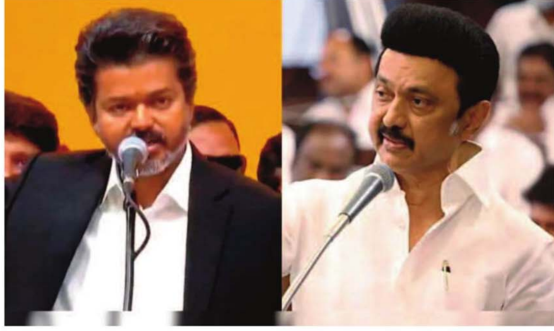
ఆగిస్తున్నాను. మీ పాలనలో తమిళనాడు అభివృద్ధి ప్రస్థానం కొనసాగాలని మరోసారి నా శుభాకాంక్షలు!' అని తన సందేశాన్ని ముగించారు స్టాలిన్. కాగా.. కేంద్రంలో డి.వి.కేకు చిరకాల మిత్రపక్షమైన కాంగ్రెస్ మద్దతుతో నిన్న(ఆదివారం) డి.వి.కే ప్రభుత్వాన్ని ఏర్పాటు చేసిన సంగతి తెలిసింది. ఈ సందర్భంగా సీఎం విజయ్ కు ఎక్స్ వేదికగా హృదయపూర్వక అభినందనలు తెలిపారు స్టాలిన్. ముఖ్యమంత్రిగా బాధ్యతలు స్వీకరించిన వెంటనే విజయ్ సంతకం చేసిన ప్రకటనలను కూడా ఆయన స్వాగతించారు. ప్రతి ఇంటికి 200 యూనిట్లు ఉచిత విద్యుత్, రాష్ట్రంలో మాదిక ద్రవ్యాల నిరోధక టాక్స్ రద్దును ఏర్పాటు చేయడం వంటివి ప్రధాన ప్రకటనలలో ఉన్నాయి.

చెన్నై, మే 11: తమిళనాడు నూతన ముఖ్యమంత్రిగా డి.వి.కే. బీసెన్ జోన్స్ విజయ్ ప్రమాణ స్వీకారం చేసి 24 గంటలు గడవకముందే ప్రతిపక్షాలు ఆయనపై విమర్శలకు దిగాయి. ఆ రాష్ట్ర మజిలీ ముఖ్యమంత్రి, డి.వి.కే. బీసెన్ ఎంకే. స్టాలిన్ విజయ్ ప్రసంగాన్ని తప్పుబడుతూ ఆగ్రహం వ్యక్తం చేశారు. గత ప్రభుత్వ ఆర్థిక పనితీరును విమర్శించడంపై సీఎం విజయ్ను హెచ్చరించారు స్టాలిన్. అప్పుడపై శ్వేతపత్రం విడుదల చేస్తామన్న విజయ్ మాటల్ని తప్పుబట్టిన ఆయన.. అబద్ధ ప్రకారాలు ఆపాలంటూ చురకలంటించారు. 'ప్రభుత్వం వద్ద డబ్బులేదని వెంటనే చెప్పడం ప్రారంభించవద్దు. డబ్బు ఉంది.. కావాలింది దానిని ప్రజలకు ఇవ్వాలనే సకల్యం, పాలించే సామర్థ్యం. ఐదేళ్లుగా కొవిడ్, వరదల వంటి సంక్షోభాలు సహా కేంద్ర బీజేపీ ప్రభుత్వం నిర్లక్ష్యంతో పోరాడుతూనే.. మేం ఎన్నో సంక్షేమ పథకాలను అమలు చేశాం. 'గత ప్రభుత్వం రూ. 10 లక్షల కోట్ల అప్పును వదిలేసి ఖజానాను ఖాళీ చేసింది' అనే ఆరోపణను మీ మొదటి ప్రసంగంలోనే ప్రస్తావించారు. నిజానికి రాష్ట్రంలో అప్పు పరిమిత స్థాయిలోనే ఉంది. ఫిబ్రవరి బడ్జెట్లోనే మేం రాష్ట్ర ప్రభుత్వ ఆర్థిక పరిస్థితిని స్పష్టంగా వివరించాం. ఆ విషయం మీకు తెలియదా? మీకు ఓటు వేసిన ప్రజలను మోసం చేసి.. విషయాన్ని పక్కదారి వచ్చిచే ప్రయత్నం చేయవద్దు! 'అవరణాత్మకంగా సాధ్యమయ్యే వాగ్దానాలు మాత్రమే ఇస్తాను' అని చెప్పి అధికారంలోకి వచ్చిన మీరు.. ఇప్పుడిప్పుడే ప్రభుత్వ పాలనను ప్రారంభిస్తున్నారు. మాలాగీ మీరు కూడా ప్రజలకు ఇచ్చిన వాగ్దానాలను ఎలా నెరవేర్చాలనే మేళకువలను త్వరలోనే తప్పకుండా నేర్చుకుంటారని నమ్ముతున్నాను. మీకు ఓటు వేసిన ప్రజలతో పాటు నేనూ అదే