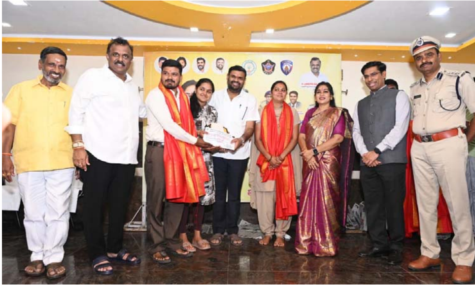
శ్రీకాళహస్తి, ఉత్తేజం మే 18: