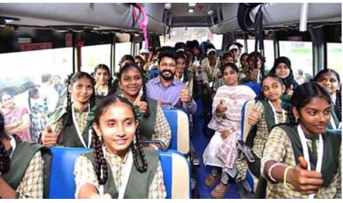
ఉన్నత విజయాల సాధించగలరని నిరూపించిన గుంటూరు పశ్చిమ నియోజకవర్గ టెన్త్ టాపర్లకు అరుదైన అవకాశం లభించింది.