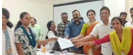
మెడికల్ కాలేజీలో అధికారులు అదేవిధంగా డివిజన్ స్థాయి పలు శాఖల అధికారులు సిబ్బంది హాజరయ్యారు.