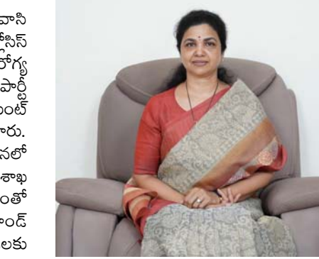
ఈ పశువులను తక్షణమే పూర్తిస్థాయి ప్రత్యేక పర్యవేక్షణలో ఉంచి, ఇతర ప్రాంతాలకు తరలించే అవకాశాన్ని పూర్తిగా నిలిపివేయాలని ఆమె స్పష్టం చేశారు.