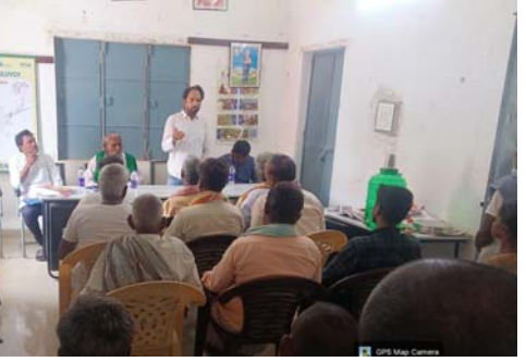
గ్రామ సర్పంచ్ మాట్లాడుతూ, బాల్య వివాహాల ఆడపిల్లల ఆరోగ్యం, భవిష్యత్తుపై తీవ్ర ప్రభావం చూపుతాయని చెప్పారు.