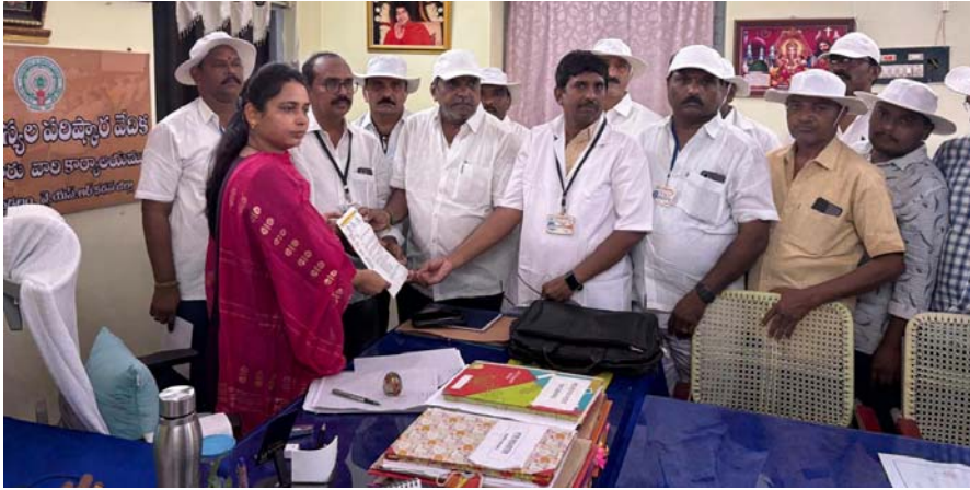
బద్వేలు ఉదయం ప్రతినిధి

తాపసిల్లూరుకు వివేకపత్రం సమర్పించిన అపోసీయేషన్ నాయకులు