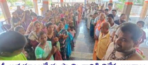
శ్రీ అభయాంజనేయ స్వామి వారికి వివేక అభిషేకం.