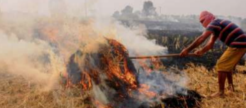
వ్యవసాయ వ్యర్థాల దహనం..