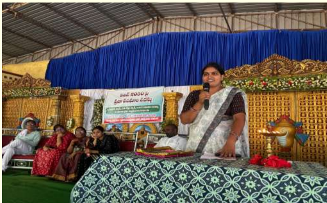
విజేత : తుర్రుపల్లి : తుర్రుపల్లి మండల కేంద్రంలో జనరల్ బాడీ అవసరమైన సాంకేతిక మార్గదర్శకత్వం అందించడానికి సిద్ధంగా