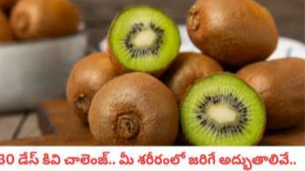
30 డెస్ కివి చాలెంజ్.. మీ శరీరంలో జరిగే అద్భుతాలివే..

కివి పండు చిన్నగా, చూడటానికి ఆకర్షణీయంగా కనిపించినా, ఇది ఆరోగ్య ప్రయోజనాల పవర్ హౌస్ గా చెప్పవచ్చు. ఇందులో విటమిన్ సి, ఫైబర్ శక్తివంతమైన యాంటీఆక్సిడెంట్లు పుష్కలంగా ఉన్నాయి. ఇది కేవలం రుచికి మాత్రమే కాదు, మన శరీరంలోని ప్రతి భాగానికి మేలు చేస్తుంది. ప్రతిరోజూ కివి పండు తినడం అలవాటు చేసుకుంటే మీ జీవితంలో ఎలాంటి అద్భుతమైన ఆరోగ్య మార్పులు జరుగుతాయో ఇప్పుడు తెలుసుకుందాం. అనేక విధిలో పండ్లలో కివి ఒకటి. దీని బయటి భాగం కొద్దిగా గరుకుగా ఉన్నా, లోపల ఆకుపచ్చని రంగు, నల్లటి గింజలతో అద్భుతమైన రుచిని, పోషకాలను అందిస్తుంది. వైద్యులు కూడా దెంగన్న వంటి రోగాల సమయంలో ఫ్లేట్ లెట్స్ ను పెంచడానికి కివి తినమని సిఫార్సు చేస్తుంటారు. విటమిన్ సి యొక్క అసాధారణ మూలమైన కివిని రోజువారీ ఆహారంలో భాగం చేసుకోవడం వలన, మీ నిద్ర నాణ్యత మెరుగుపడుతుంది, జీర్ణ సమస్యలు మటుమాయమవుతాయి ముందు గుండె జబ్బుల నుండి రక్షణ లభిస్తుంది. ఈ పండు అందించే టాప్ 10 ఆరోగ్య ప్రయోజనాల జాబితాను వివరంగా చూద్దాం.