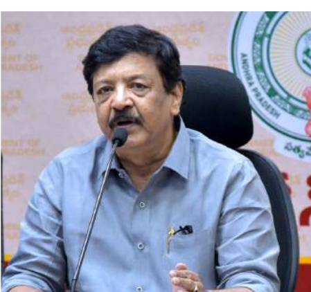
బోర్డులను తప్పనిసరిగా ఉంచాలి." అన్నారు. బాధిత కుటుంబాలకు ప్రభుత్వం నుంచి అందాల్సిన అన్ని రకాల సహాయ సహకారాలు త్వరితగతిన అందేలా చూడాలని మంత్రి దుర్గేష్ సందర్భంగా అధికారులకు సూచించారు.

జిల్లా అధికారులను ఆదేశించారు. అలాగే, ఈ ప్రమాదంలో గాయపడిన క్షతగాత్రులను కాకినాడ ++ (ప్రభుత్వ సర్జన ఆసుపత్రి) కి తరలించి, వారికి అత్యంత మెరుగైన వైద్య సేవలు అందించాలని వైద్య అధికారులకు ప్రత్యేక సూచనలు జారీ చేశారు. ఈ ఘోర ప్రమాదం నేపథ్యంలో మంత్రి కందుల దుర్గేష్ భద్రతా ప్రమాణాలపై అధికారులకు కఠిన ఆదేశాలు జారీ చేశారు. "పాట్లకూటి కోసం వెళ్ళిన క్రామికులు ఇలా అనంత లోకాలకు వెళ్ళడం సన్ను తీవ్రంగా కలవిచేసింది. ఈ కక్షకాలంలో మృతి చెందిన క్రామికుల కుటుంబాలకు ప్రభుత్వం అన్ని విధాలా అండగా ఉంటుంది. ఇకపై పని ప్రదేశాల్లో ఇటువంటి ప్రమాదాలు పునరావృతం కాకుండా తక్షణమే కఠిన చర్యలు చేపట్టాలి. జాతీయ రహదారులు, జైహెచ్ రోడ్ల వెంబడి ఉపాధి పనులు జరిగే చోట వాహనాల వేగం నియంత్రించేలా ప్రత్యేక వేగ నియంత్రణ బోర్డులను ఏర్పాటు చేయాలి. ముఖ్యంగా ట్రాఫిక్ రద్దీ ఎక్కువగా ఉండే ప్రాంతాల్లో కూలీల భద్రత దృష్ట్యా హెచ్చరిక