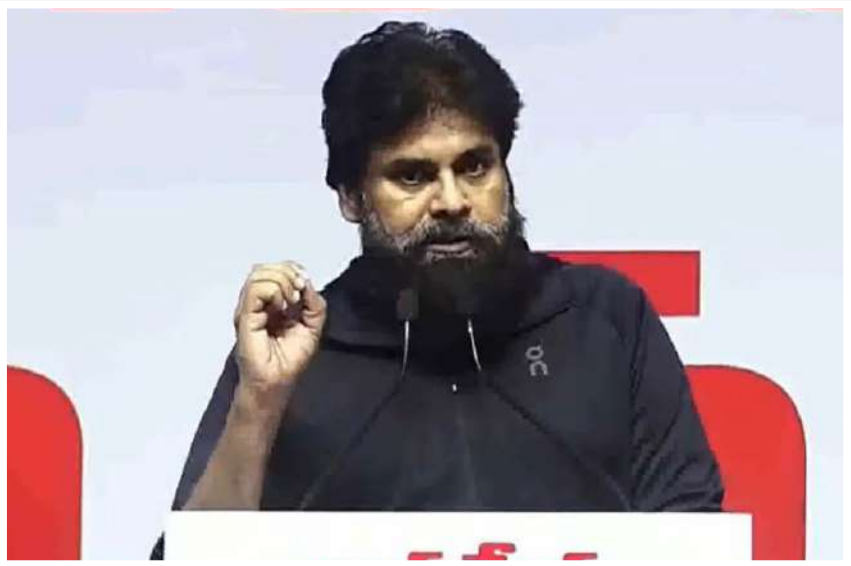
అందుకే విజయ్ తో : ఇక తమిళనాడులో విజయ్ పార్టీ గెలవడం ఏంటి అటు బీఆర్ఎస్ ఇటు వైసీపీ కూడా పెద్ద ఎత్తున రియోక్ట్ అయిపోయాయి. అంతే కాదు విజయ్ కి కంగ్రాట్స్ చేస్తూ చెబుమికి తెర తీశాయి. ఇక్కడ వైసీపీకి డీపీకేకి సిద్ధాంతపరంగా సారూప్యం కంటే రెండు పార్టీలకూ ట్రియల్ మైనారిటీ ఓటు ఔన్ మాత్రం ఒక కామన్ పాయింట్ గా చెబుతున్నారు.ఇక సంక్షేమ పథకాలు ఇతర అంశాలలో జగన్ స్ట్రాటజీని విజయ్ ఫాలో అవుతున్నారని

కింగ్ మేకర్ కాబున్నాడే: మరో వైపు చూస్తే జనసేన వచ్చే ఎన్నికల నాటికి ఏవీలో కింగ్ మేకర్ గా కావాలన్నది కూడా ఆలోచిస్తోంది అని అంటున్నారు పవన్ తాజాగా పార్టీ వేదిక మీద చేసిన వ్యాఖ్యలు సంస్థాగతంగా పార్టీని బలోపేతం చేసుకుంటున్న తీరు స్థానిక సంస్థల ఎన్నికల మీద గురి పెడుతున్న విధానం, మీరే మాకు ముఖ్యం, అత్య గౌరవాన్ని దెబ్బ తీయడం అంటూ క్యాడర్ లో నింపుతున్న ఉత్తేజం ఇవన్నీ వెరసి 2029 ఎన్నికల నాటికి జనసేన గట్టిగా బలం పుంజుకుని రాష్ట్ర రాజకీయాల్లో మరింతగా తన సత్తాను చాటేందుకు సమాధుత్తం అవుతోంది అని విశ్లేషిస్తున్నారు. మొత్తానికి తమిళనాడు ఎన్నికల్లో విజయ్ సాధించిన సక్సెస్ ఏవీలో జనసేన మీద బాగానే ప్రభావం చూపిస్తోంది అని అంటున్నారు. రానున్న రోజులలో జనసేన దూకుడు కూడా పెరగనుంది అని అంటున్నారు. చూడాలి మరి ఏమి జరుగుతుందో.