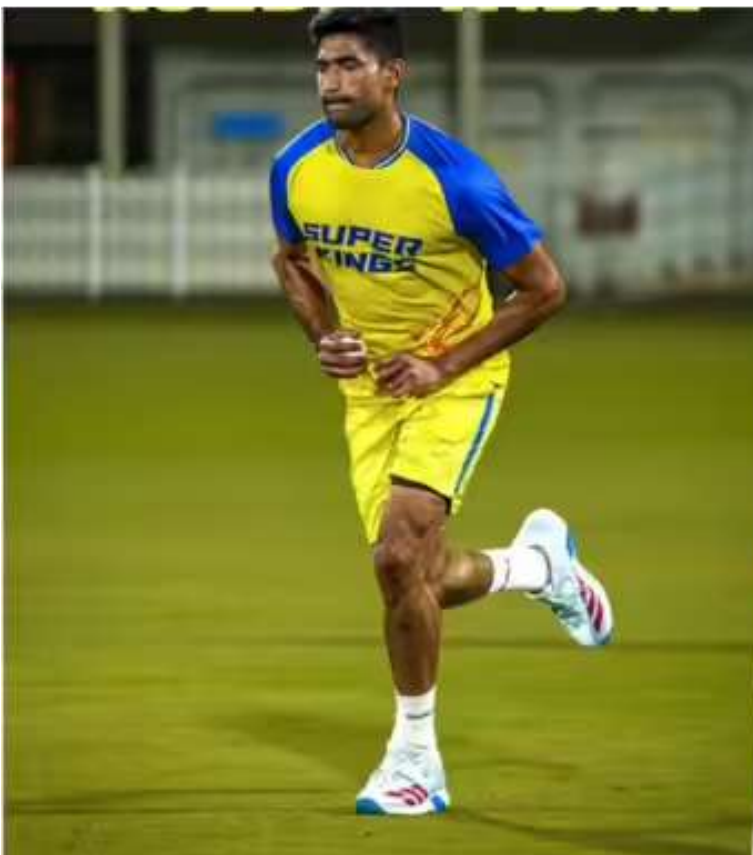
మీడియాలో ప్రకటించింది. కాగా కుల్టీవ్ గతంలో ఐపీఎల్లో రాజస్థాన్ రాయల్స్ జట్టులో సభ్యుడిగా ఉన్నాడు. తాజాగా సీఎస్కేలో చేరిపోయాడు. జెమీ ఓవర్లన్ షేనులో దక్షిణాఫ్రికా క్రూరాడు డియాన్ ఫారెస్టర్ కూడా ఇటీవల సీఎస్కేలో చేరడం గమనార్హం. మరోవైపు డిఫెండింగ్ ఛాంపియన్ ఆర్నీబీ కూడా జట్టులో మార్పులు చేసింది. ఫిట్నెస్ టెస్టులో విఫలమై.. ఐపీఎల్ 2026కు దూరమైన

అనుభవం ఆర్నీబీ బౌలింగ్కు బలాన్నిస్తుందని ప్రాంచైజీ భావిస్తోంది. ఐపీఎల్ 2026లో షే ఆఫ్స్ సమీపిస్తున్న వేళ.. టాప్లో నిలిచిన జట్టు కొత్త ఆటగాళ్లతో జట్టును మరింత పటిష్ఠం చేసుకుంటున్నాయి. గాయపడి బోర్లకి దూరమైన ఆటగాళ్ల షేనులో మరో ఆటగాడిని జట్టులో చేర్చుకుంటున్నాయి. ఈ జాబితాలో డిఫెండింగ్ ఛాంపియన్ రాయల్ ఛాలెంజర్స్ బెంగళూరు, చెన్నై సూపర్ కింగ్స్ జట్టు నిలిచాయి. ఇదివరకే గాయపడ్డ ఓవర్లన్ షేనులో.. దక్షిణాఫ్రికా ఆల్ రౌండర్ డియాన్ ఫారెస్టర్ను తీసుకున్న సీఎస్కే.. మరో రిటీర్మెంట్ను ప్రకటించింది. ఇదే సమయంలో ఆర్నీబీ.. తమ స్క్వాడ్లోకి ఇంగ్లండ్ పేసర్ రిచర్డ్ గ్లీసన్ తీసుకుంది. నిజానికి చెన్నై సూపర్ కింగ్స్ జట్టును ఈసారి గాయాల బెడద తీవ్రంగా వేధిస్తోంది. నాథన్ ఎల్లిస్, ఖల్సీల్ అహ్మద్, ఆయుష్ మాత్రే, రామకృష్ణ ఘోష్ జెమీ ఓవర్లన్ గాయాల కారణంగా బోర్లకి దూరమయ్యారు. స్పెన్సర్ జాన్సన్, డివాల్ట్ బ్రెవిస్ కొన్ని మ్యాచ్లకు అందుబాటులో లేకుండా పోయారు. మహేంద్ర సింగ్ ధోనీ కూడా గాయం కారణంగా ఇప్పటివరకు ఈ సీజన్లో ఒక్క మ్యాచ్ కూడా ఆడలేదు. ఈ సీజన్లో చివర్లో బలంగా వుంటామని.. షే ఆఫ్స్ రేసులో నిలిచిన చెన్నై సూపర్ కింగ్స్.. గాయపడ్డ పేసర్ ఖల్సీల్ అహ్మద్ స్టాంలో కుల్టీవ్ యాదవ్ను తీసుకుంది. రూ. 30 లక్షలకు కుల్టీవ్తో ఒప్పందం కుదిరినట్లు సోషల్