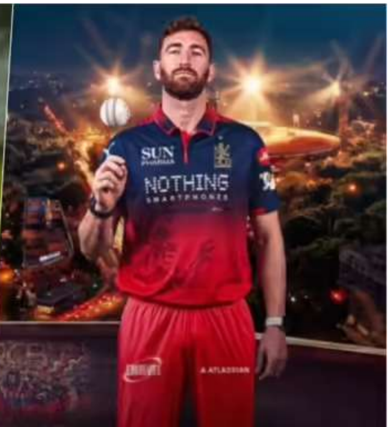
శ్రీలంకకు చెందిన సువాన్ తుషారా షేనులో ఇంగ్లాండ్కు చెందిన రిచర్డ్ గ్లీసన్ను తీసుకుంది. రూ. 1.6 కోట్లకు అతడిని దక్కించుకుంది. 2022లో అరంగేట్రం చేసిన గ్లీసన్.. ఇంగ్లాండ్ తరపున ఆరు టీ20లు ఆడాడు. ప్రాంచైజీ క్రికెట్లో మాత్రం 145 మ్యాచ్లలో 170 వికెట్లు తీశాడు.