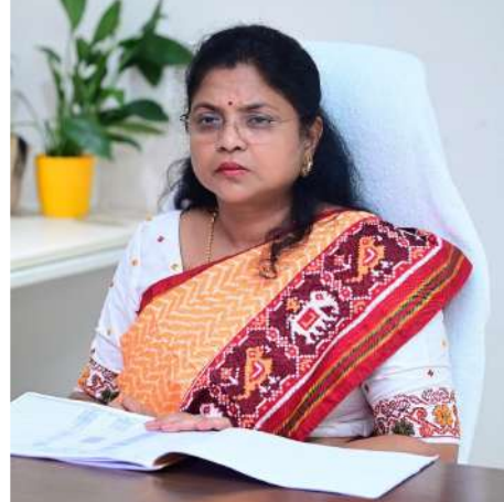
జిల్లా కలెక్టర్ శ్రీమతి చదలవాడ నాగరాణి