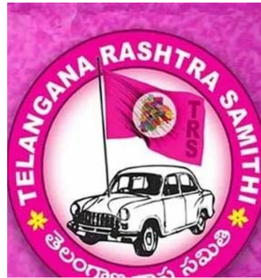
హైదరాబాద్ ప్రతినిధి, ఉదయం న్యూస్