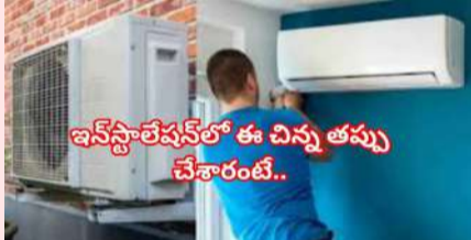
ఇన్స్టాలేషన్లో ఈ చిన్న తప్ప చేశారంటే భారీ ప్రమాదంలో పడే ఛాన్స్..!