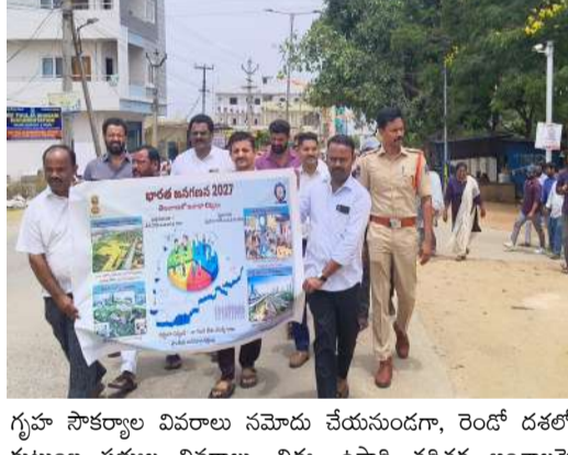
గృహ సౌకర్యాల వివరాలు సమైక్యం చేయడంగా, రెండో దశలో కుటుంబ సభ్యుల వివరాలు, విద్య, ఉపాధి తదితర అంశాలపై