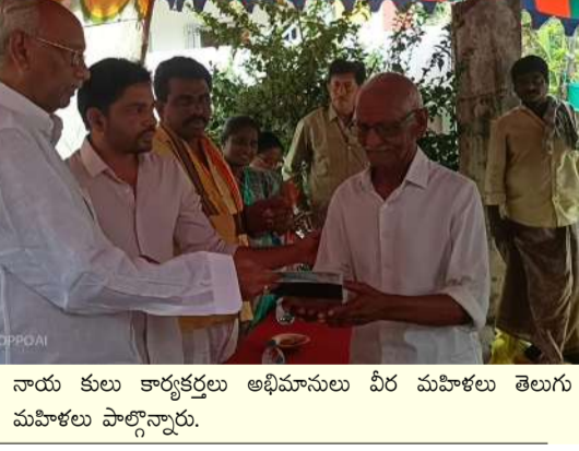
పాస్ నాయకులు కార్యక్రమాల అభిమానులు వీర మహిళలు తెలుగు మహిళలు పాల్గొన్నారు.

అంజిబాబు పంపిణీ చేశారు. ఎమ్మెల్యే అంజిబాబు మాట్లాడుతూ మీ భూమి-మీ హక్కు రైతులకు, భూ యజమానులకు ప్రభుత్వం ఇచ్చే భరోసా అని, అన్ని అనేది ప్రతి పౌరుడి రాజ్యంగం బద్ద హక్కు అని అన్నారు. గత ప్రభుత్వం హయాంలో వ్యక్తిగత పోటీలతో ముగిసిన పాసు పుస్తకాల ఇవ్వడం వల్ల అనేక సాంకేతిక, న్యాయ సంబంధిత సమస్యలు తలెత్తాయని, ప్రస్తుతం ముఖ్యమంత్రి చంద్రబాబు నాయకత్వంలో కూటమి ప్రభుత్వం అధికారిక రాజముద్దతో కూడిన పట్టాదారు పాసు పుస్తకాలను అందజేస్తూ భూ యజమానులకు హక్కులపై సంపూర్ణ భరోసాను కల్పిస్తోందన్నారు. అనంతరం రైతులకు ఎమ్మెల్యే అంజిబాబు పుస్తకాలను అందించారు.కార్యక్రమంలో గ్రామ పెద్దలు, కూటమి