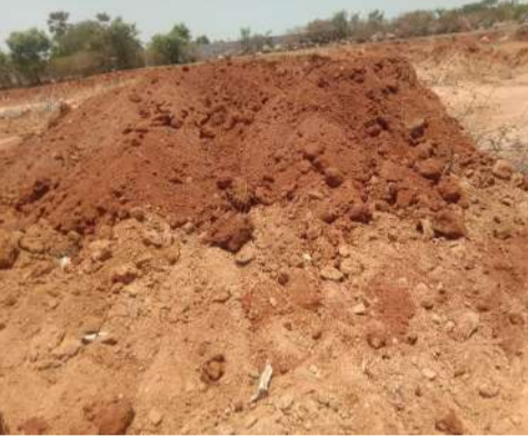
అసైన్డ్ భూముల ఆధారా మట్టి తవ్వకాలు

మట్టి మాఫియా పై చర్యలు తీసుకోవాలని ప్రజలు డిమాండ్ విజేత మామిడి : మహేశ్వరం మండలంలోని గంగారం, ఉప్పగర్ల తండా, కావలీని భాయ్ తండా సమీపంలోని అసైన్డ్ భూములలో ప్రతిరోజూ ఆర్డర్లు మట్టి మాఫియా యజ్ఞులగా మట్టి దండాలను సమర్పించుతున్నారు. ఇంత పెద్ద మాఫియా మొత్తంలో మట్టి దండాలను నిర్వహిస్తుంటే అధికారులు నిద్రకుం, పోలీసులు పట్టించుకోవడంపై గ్రామస్థులు, రైతులు, రాజీ అయితే చాలు నిద్ర పోవాలంటే కష్టంగా మారుతుంది. రాజీ సమయంలో మట్టి తవ్వకం సమర్పించుటే పోలీస్, పెట్రోలింగ్ ఏఎన్ టి సి నిఘా సంస్థలు చూసి చూడనట్లు వ్యవహరిస్తున్నారు. ఇంత పెద్ద పెద్ద ఎత్తున సమర్పించుటే చూసి చూడనట్లు అధికారులు వ్యవహరించడంతో మట్టి దండా వ్యాపారస్తులు రెచ్చిపోతున్నారనే సందేహాలు కలుగుతున్నాయి. ఉప్పగర్ల తండా, కావలీని భాయ్ తండా అసైన్డ్ భూములలో ప్రతిరోజూ వందల కొద్దీ మట్టి తవ్వకం తిరుగుతున్న అధికారులు పట్టించుకోవడం లేదని ప్రజలు ఆరోపిస్తున్నారు. అసైన్డ్ భూములలో