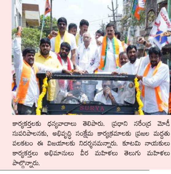
కార్యకర్తలకు ధన్యవాదాలు తెలిపారు. ప్రధాని నరేంద్ర మోడీ సుపరిపాలనకు, అభివృద్ధి సంక్షేమ కార్యక్రమాలకు ప్రజల మద్దతు వలకటం ఈ విజయాలకు నిదర్శనమన్నారు. కూటమి నాయకులు కార్యకర్తలు అభినానులు వీర మహిళలు తెలుగు మహిళలు పాల్గొన్నారు.