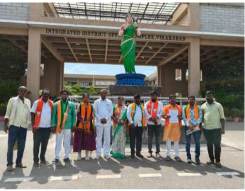
వారికి కేటాయించిన డబుల్ బెడ్ రూమ్ ఇల్లు