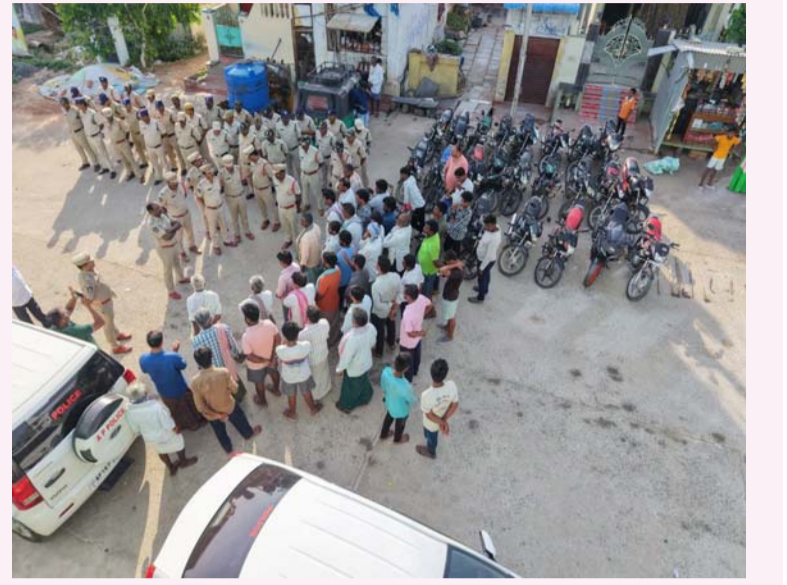
గురజాల, జూన్, 1, సూర్యోదయం ప్రతినిధి

గురజాల మండలంలోని పాత అంబాపురం గ్రామంలో సోమవారం కార్డెన్ సెర్చ్ డి.ఎస్.పి మల్ల మహేశ్వరరావు ఆధ్వర్యంలో నిర్వహించారు. ఈ ఆపరేషన్లో ద్వీపక వాహనాలు, గొడ్డళ్లు, కత్తులు, పలుపులు, స్వాధీనం చేసుకున్నారు. తనిఖీలు డి.ఎస్.పి మల్ల మల్లేశ్వరరావు సీ.ఐ. ఆవుల భాస్కరరావు ఆధ్వర్యంలో పోలీసు సిబ్బంది ఈ ఆపరేషన్లో పాల్గొని విస్తృతంగా తనిఖీలు నిర్వహించారు. గ్రామములో నేర నియంత్రణకు కట్టుదిట్టమైన చర్యల్లో భాగంగా పాత అంబాపురం గ్రామప్రాంతంలో అకస్మాత్తుగా కార్డెన్ సెర్చ్ చేపట్టారు. ఇంటింటికి తనిఖీల్లో భాగంగా నిర్వహించిన 2 గొడ్డళ్లు, కత్తులు, పలుగులు 3, అలాగే లైసెన్సులు లేని వాహనాలను సీల్ చేశారు. వాహన దారులకు తెలియజేయమని ఎవ్వరూ మీ బంధు యొక్క లైసెన్సులు ఉంటే తీసుకొని వచ్చి మీ బంధువు మీరు తీసుకుని వెళ్లవచ్చని డి.ఎస్.పి మల్ల మహేశ్వరరావు తెలియజేశారు. అదేవిధంగా గంజాయి వినియోగం అక్రమ రవాణాపై పోలీసు నిఘా పెట్టినట్లు తెలిపారు. యువత చెడు అలవాటులకు లోనై అవ్వకుండా తల్లిదండ్రులు పిల్లలు నడవడికను ఎప్పటికప్పుడు గమనించాలని ఆయన సూచించారు. ఆసాంఘిక కార్యకలాపాలకు దూరంగా ఉండాలని ప్రజలకు విజ్ఞప్తి చేస్తూ ఎలాంటి అనుమానస్పత కార్యకలాపాలు తెలిసినవెంటనే పోలీసు అధికారులకు సమాచారం ఇవ్వాలని కోరారు. ఈ కార్డెన్ చర్య సమావేశంలో గురజాల, దాచేపల్లి, సిబబర్, గురజాల ఎస్.పి.ఎస్. కుమార్, సుమారుగా 50 మంది పోలీస్ సిబ్బందితో కార్డెన్ సెర్చ్ నిర్వహించారు.