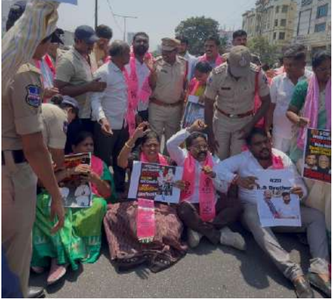
నినాదాలు చేశారు.తెలంగాణలో మహిళల భద్రత ప్రశ్నార్థకంగా మారింది. దోషులను కఠినంగా శిక్షించి బాధిత కుటుంబానికి న్యాయం చేయాలని" డిమాండ్ చేశారు."ప్రజల భద్రతను కాపాడాల్సిన ప్రభుత్వాలు రాజకీయ ప్రయోజనాల కోసం మౌనం వహించడం దురదృష్టకరం. మైనర్ బాలికపై జరిగిన అమానుష ఫుటనపై కాంగ్రెస్ ప్రభుత్వం మరియు బీజేపీ నాయకత్వం

●వోషులను వెంటనే అరెస్ట్ చేయాలి ●బి ఆర్ ఎస్ నాయకుల భారీ నిరసన శేరిలింగంపల్లి మన మహాత్మి న్యూస్ మే 12: బండి సంజయ్ కొడుకు బండి భగీరథ్ పై నమోదైన పోక్స్ కేసులో సెక్షన్స్ 7,8 పెట్టకుండా కేసు నిరుగృహణకే సెక్షన్స్ 11, 12 పెట్టారు. పోక్స్ కేసు కేంద్ర మంత్రి బండి సంజయ్ కొడుకు బండి భగీరథ్ చేసిన అఘాయిత్యానికి బాధిత మైనర్ బాలికకు న్యాయం చేయాలని డిమాండ్ చేస్తూ చందానగర్ డివిజన్ అంబేద్కర్ విగ్రహం వద్ద నేషనల్ హైవే 65 పై శేరిలింగంపల్లి బి ఆర్ ఎస్ నాయకులు,కార్యకర్తలుభారీ నిరసన తెలియజేశారు.తెలంగాణ రాష్ట్రం లో సంచలనం రేపిన పోస్కో కేసు ఫుటనపై కాంగ్రెస్ ప్రభుత్వం మరియు బీజేపీ వైఖరిని తీవ్రంగా ఖండిస్తూ శేరిలింగంపల్లి బి ఆర్ ఎస్ నాయకులు,కార్యకర్తల ఆధ్వర్యంలో భారీ నిరసన కార్యక్రమం నిర్వహించారు.ఈ సందర్భంగా బీఆర్ఎస్ నాయకులు, కార్యకర్తలు కలిసి హైవేపై బైరాయించి రోడ్డును దిగ్బంధించారు. "మైనర్ బాలికకు న్యాయం చేయాలి", "దోషులను వెంటనే అరెస్ట్ చేయాలి", "కాంగ్రెస్ -- బీజేపీ రాజకీయ నాటకాలు ఆపాలి" అంటూ