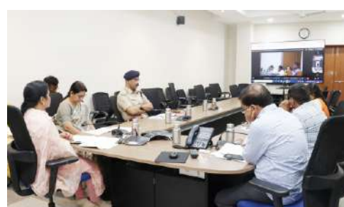
చేరవేసేందుకు ప్రత్యేక వ్యవస్థ ఏర్పాటు చేయాలని సీఎం ఆదేశించారు.ధాన్యం కొనుగోళ్ల విషయంలో కలెక్టర్లు భద్రతాయుతంగా వ్యవహరించాలని మంత్రి ఉత్తమ కుమార్ రెడ్డి సూచించగా, తెలంగాణలో రికార్డు స్థాయిలో ధాన్యం కొనుగోళ్లు జరుగుతున్నాయని మంత్రి తుమ్మల నాగేశ్వర రావు పేర్కొన్నారు.