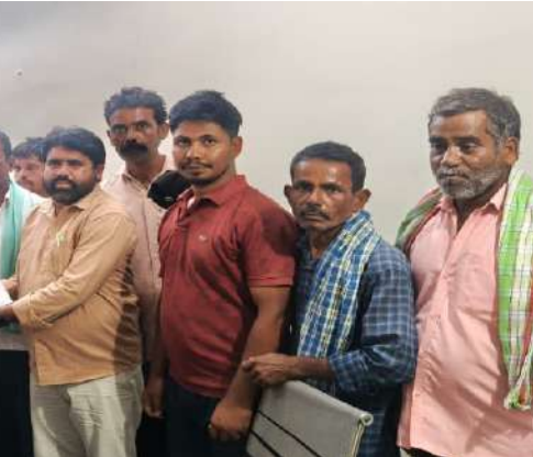
జాలోత్ నతీష్ వాంకుడోత్ వద్ద బోడ నరేష్ బానోత్ సూర్య తదితరులు పాల్గొన్నారు