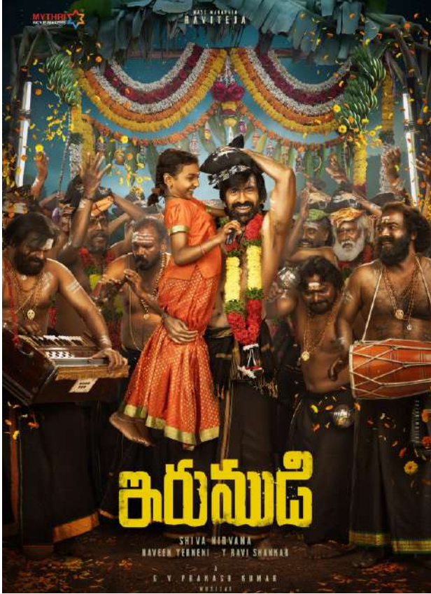
ప్రస్తుతం తన రెమ్మూనరేషన్ రూ. 15 కోట్లకు తగ్గించుకున్నారని ప్రచారం. నిర్మాతలపై అదనపు భారం పడకుండా ఉండాలనే ఉద్దేశంతోనే ఈ నిర్ణయం తీసుకున్నారని టాలీవుడ్ వర్గాలు చెబుతున్నాయి. వరుస డిజాస్టర్ల తర్వాత మార్కెట్లో తన స్థాయిని మళ్లీ నిలబెట్టుకోవాలంటే ముందుగా మంచి విజయాన్ని అందుకోవాల్సి వచ్చింది.

మాస్ మహారాజా రవితేజ గత కొంతకాలంగా బాక్సాఫీస్ వద్ద సరైన విజయాన్ని అందుకోలేక ఇబ్బందులు ఎదుర్కొంటున్నారు. ఒకప్పుడు వరుస పాట్లతో టాలీవుడ్లో తనకంటూ ప్రత్యేక మార్కెట్ను సృష్టించుకున్న రవితేజ, ఇప్పుడు వరుస పరాజయాలతో కెరీర్లో వైఫల్య దశను ఎదుర్కొంటున్నారు. ఇటీవల విడుదలైన సినిమాలు ప్రేక్షకులను ఆశించిన స్థాయిలో ఆకట్టుకోకపోవడంతో, ఆయన తన తదుపరి ప్రాజెక్టుల విషయంలో చాలా జాగ్రత్తగా వ్యవహరిస్తున్నట్లు సినీ పర్సాల్లో చర్చ సదున్నోంది. ఇప్పటివరకు కమర్షియల్ ఎంటర్టైన్మెంట్లో ప్రేక్షకులను ఆలంచిన రవితేజ, ఇప్పుడు మార్కెట్ పరిస్థితులను బట్టి తన నిర్ణయాల్లో మార్పులు చేస్తున్నారని తెలుస్తోంది. ముఖ్యంగా రెమ్మూనరేషన్ విషయంలో ఆయన తీసుకున్న తాజా నిర్ణయం చిత్రసీమలో హాట్ టాపిక్ గా మారింది. ఒకప్పుడు సినీమా కోసం రూ. 25 కోట్ల పరకు పారితోషికం తీసుకున్న రవితేజ,