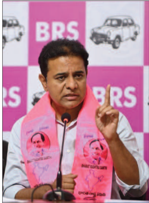
నిర్లక్ష్యానికి అర్థం పడుతున్నాయని మండిపడ్డారు. ప్రభుత్వ అసమర్థత, ముందుచూపు లేకపోవడం వల్లే నేడు రైతులు

పంటల కొనుగోలు లేక దీనావస్థ వారిని వెంటనే ప్రభుత్వం ఆదుకోవాలి బీఆర్ఎస్ శ్రేణులు రైతులకు అండగా నిలవాలి పార్టీ వర్కర్ల ప్రసిడెంట్ కేటీఆర్ పిలుపు