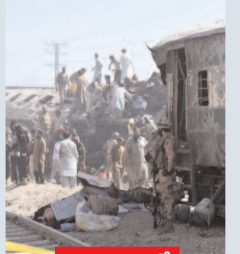
.. వివరాలు 3లో

పాక్ లో రైలుపై ఆత్మాహుతి దాడి 30 మంది మృతి తామే చేశామని ప్రకటించుకున్న బలోచ్ లిబరేషన్ ఆర్మీ