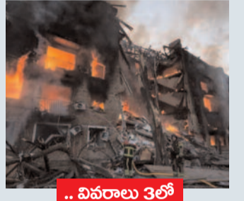
.. వివరాలు 3లో

ఉక్రెయిన్ పై 'బరెషిక్' క్షిపణితో రష్యా దాడి నలుగురి మృతి.. 100 మందికి గాయాలు