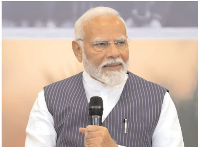
న్యూఢిల్లీ - ఆంధ్రనాడు, మే 28

అంతర్జాతీయ జల వివాదాలపై ప్రధానమంత్రి నరేంద్ర మోదీ కీలక సూచన చేశారు. ఈ మేరకు ప్రభుత్వం ఒక ప్రకటనలో తెలిపింది. జల వివాదాలను సహకార ధోరణితో పరిష్కరించుకోవాలని రాష్ట్రాలకు సూచించారు. సకాలంలో అనుమతులు, సాంకేతిక ఆధారిత పర్యవేక్షణ ద్వారా ఈ సమస్యలను అధిగమించాలని అన్నారు. ఈ సందర్భంగా ఆయన కెన్-బెట్వా ప్రాజెక్టు నమూనాను ఉదహరించారు. భారతదేశంలో మొట్టమొదటి నదుల అనుసంధాన ప్రాజెక్టు కెన్-బెట్వా ప్రాజెక్టు. మధ్యప్రదేశ్ లోని కెన్ నదిలో ఉన్న అదనపు జలాలను కాలువ ద్వారా ఉత్తరప్రదేశ్ లోని బెట్వా నదికి మళ్లిస్తారు. ఈ నేపథ్యంలో మోదీ మాట్లాడుతూ, రాష్ట్రాల మధ్య నీటి సమస్యల పరిష్కారానికి ఇది ఆదర్శ మోడల్ గా పేర్కొన్నారు. ప్రధాని మోదీ కెన్ - బెట్వా నదుల అనుసంధాన ప్రాజెక్టు సహా ఆయా రాష్ట్రాల్లో రూ.30 వేల కోట్ల విలువైన అభివృద్ధి పనులపై సమీక్ష నిర్వహించారు. ప్రాజెక్టుల అమలులో జాప్యం, ఖర్చుల పెరుగుదలకు దారితీయడమే కాకుండా, పౌరులకు అవసరమైన సౌకర్యాలను సకాలంలో అందకుండా చేస్తుందని మోదీ వ్యాఖ్యానించారు. నీటి భద్రత కోసం నదుల అనుసంధానం, జల సంరక్షణ, భూగర్భ జలాల పునరుజ్జీవం వంటి అంశాల్లో అవకాశాలను గుర్తించాలని సూచించారు. స్వచ్ఛ భారత్ మిషన్ - అర్బన్ 2.0ను కూడా సమీక్షించారు. ఆయా నగరాల్లో రూఫ్ టాప్ సోలార్ ప్యానెళ్ల ఏర్పాటు మార్గాలను అన్వేషించాలని అన్నారు. పెండింగ్ సమస్యల పరిష్కారానికి కేంద్ర, రాష్ట్ర ప్రభుత్వాలు మరింత చురుకైన పనిచేయాలని ప్రధాని మోదీ సూచించారు.