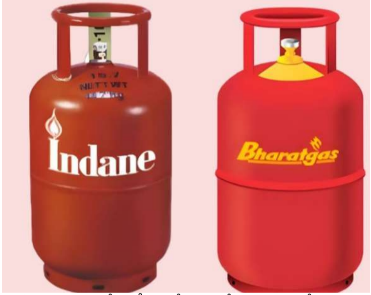
వ్యాపార సంస్థలలో హోటల్లో బార్లో రెస్టారెంట్లలో డొమెస్టిక్ సిలిండర్లు వాడుతూ వ్యాపారాలు చేస్తున్న యజమానులపై తగు చర్యలు తీసుకోవాలని సివిల్ సప్లై అధికారులు తనిఖీలు చేయాలని చిన్నబావి మండల ప్రజలు కోరుతున్నారు.

విజేత, చిన్నబావి : చిన్నబావి మండల కేంద్రంలోని పలు హోటల్లో గృహ అవసరాలకు వినియోగించే (డొమెస్టిక్) సిలిండర్లను వ్యాపార సంస్థలకు వినియోగిస్తూనే హోటల్ యజమానులు, గృహ అవసరాలకు వినియోగించే డొమెస్టిక్ సిలిండర్ లను వ్యాపార సంస్థలలో మరియు హోటల్ రెస్టారెంట్లలో వినియోగించడం చట్టం రీత్యా నేరం అని అనేక సందర్భాలలో అధికారులు చెబుతున్న హోటల్ యజమానులు పట్టించుకోవడం లేదు. వ్యాపార సంస్థలలో, హోటల్, ధాబాల యజమానుల్లో ఎలాంటి మార్పు రాలేదు. హోటల్ యజమానులు తప్పనిసరిగా వాణిజ్య (కమర్షియల్) సిలిండర్లను మాత్రమే ఉపయోగించాలని నిబంధనలు ఉన్న, నిబంధనలు ఉల్లంఘించిన వారిపై చట్టపరమైన చర్యలు కొనసాగుతాయని సివిల్ సప్లై అధికారులు గతంలో ఎన్నోసార్లు హెచ్చరించారు. ప్రజలకు ఎలాంటి ఇబ్బందులు కలగకుండా గ్యాస్ సరఫరా వ్యవస్థను సక్రమంగా నిర్వహించేందుకు అధికారులు కట్టుబడి ఉన్నారని పలుమార్లు అధికారులు చెబుతున్నారు. ప్రజలు ఓటిపీలు రాక సిలిండర్లు సకాలంలో అందక నానక ఇబ్బందులు పడుతుంటే అధిక రేట్లకు భాకులలో హోటల్ యజమానులు సిలిండర్లు తీసుకొని వాడుకోవడం జరుగుతుంది. అధిక రేట్లకు సిలిండర్లు బ్లాక్ లో కొనుగోలు చేస్తూ వ్యాపారంలో టిఫిన్లపై అధిక రేట్లు వసూలు చేస్తున్న హోటల్ యజమానులు. వాణిజ్య సంస్థలలో