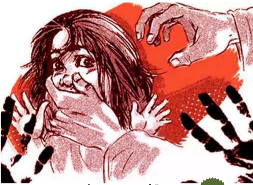
ఆమెను బలవంతంగా బస్సులోకి లాగారు. నాంగ్లోయ్ వైపు అనంతరం వారు బస్సును రాజీ బాగ్ నుంచి తీసుకెళ్లి ఆమెపై ...

విజేత, న్యూ ఢిల్లీ, మే 14 : దేశ రాజధాని ఢిల్లీలో మరో దారుణ ఘటన చోటుచేసుకుంది. నాంగ్లోయ్ ప్రాంతం లో కదులుతున్న ప్రైవేట్ బస్సులో ఒక మహిళపై సామూహిక అత్యాచారం జరిగింది. బాధితురాలి ఫిర్యాదు మేరకు కేసు నమోదు చేసుకున్న పోలీసులు ఇద్దరు నిందితులను అరెస్ట్ చేశారు. అత్యాచారానికి ఉపయోగించిన బస్సును కూడా స్వాధీనం చేసుకున్నట్లు గురువారం వెల్లడించారు. పోలీసులు తెలిపిన వివరాల ప్రకారం పితంపుర్ మురికివాడలో నివసించే బాధితురాలు మంగోల్ పురిలోని ఓ ఫ్లాక్టర్ లో పనిచేస్తున్నారు. మే 11న (సోమవారం) రాత్రి పని ముగించుకుని నడుచుకుంటూ ఇంటికి తిరిగి వస్తున్నారు. ఈ క్రమంలో నరసృతి విహార్ వద్ద ఆగి ఉన్న ఒక స్టీప్ బస్సు డోర్ వద్ద నిలబడిన వ్యక్తిని ఆమె టైమెంట్ అని అడిగింది. వెంటనే అతను, మరో వ్యక్తి