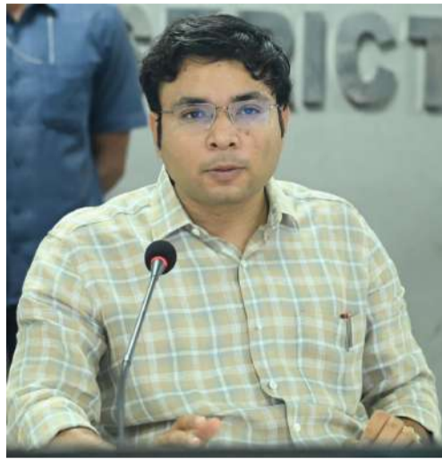
సిబ్బంది, తదితరులు పాల్గొన్నారు.