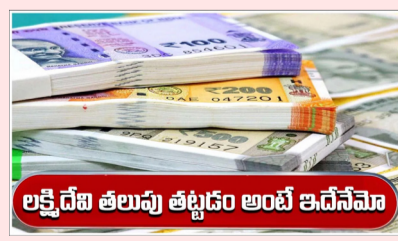
లక్ష డేజీ తలుపు తట్టడం అంటే ఇదేనేమా

ఇన్వెస్టర్లకు ధనవంతులను చేసింది స్మార్ట్ క్యాప్ కేటగిరిలోని పేపర్ ప్రొడక్ట్ రంగానికి చెందిన గౌతమ్ ఎన్టీ లిమిటెడ్ కంపెనీ. తమ పేర్ హోల్డర్లకు బంపర్ ఆఫర్ ప్రకటించింది. దీంతో లక్ష రూపాయలు కాస్త 14 లక్షలుగా మారిపోయింది.. స్టాక్ మార్కెట్లో సరైన సమయంలో సరైన స్టాక్ను గుర్తిస్తే అది సంపదన ఎలా పెంచుతుందో చెప్పడానికి ఈ కంపెనీని నిదర్శనం. స్మార్ట్ క్యాప్ కేటగిరిలోని పేపర్ ప్రొడక్ట్ రంగానికి చెందిన గౌతమ్ ఎన్టీ లిమిటెడ్ తమ పేర్ హోల్డర్లకు బంపర్ ఆఫర్ ప్రకటించింది. ఒకేసారి స్టాక్ స్పిట్, బోనస్ షేర్లను ప్రకటించి ఇన్వెస్టర్లను ఖుషి చేసింది. కంపెనీ ఎక్స్చేంజ్ ఫైలింగ్ ప్రకారం.. ఏప్రిల్ 30న జరిగిన బోర్డు డైరెక్టర్ల సమావేశంలో 1:2 రేషియోలో స్టాక్ స్పిట్ చేపట్టడంకూ ఆమోదం లభించింది. 100 షేర్లు ఉంటే 800 షేర్లు ఎలా వస్తాయి? కంపెనీ బోర్డు డైరెక్టర్ల నిర్ణయం ప్రకారం.. రెండు రకాల ప్రయోజనాలు ఇన్వెస్టర్లకు అందనున్నాయి.