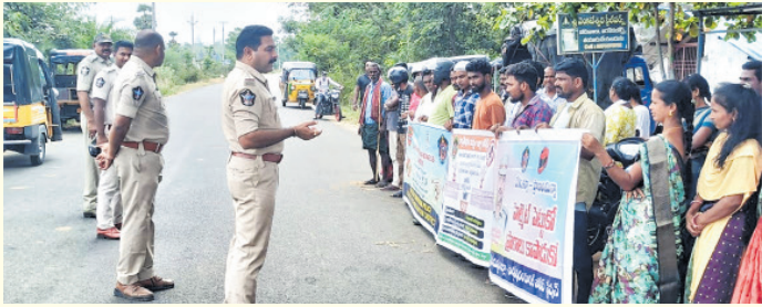
పార్వతీపురం మనసులో మాట జిల్లా ప్రతినిధి, మే 28:

సంకల్పం 2.0 కార్యక్రమంలో భాగంగా పార్వతీపురం రూరల్ పోలీస్ స్టేషన్ పరిధిలోని అడ్డాపుసల జంక్షన్ వద్ద గురువారం ప్రజలకు అవగాహన కార్యక్రమం నిర్వహించారు. పార్వతీపురం రూరల్, కొమరాడ పోలీస్ స్టేషన్ల ఎస్.ఐ.లు, సిబ్బంది కలిసి నిర్వహించిన ఈ కార్యక్రమంలో మాదకద్రవ్యాల వినియోగం వల్ల కలిగే దుష్పరిణామాలు, మహిళలపై నేరాల నివారణ, సైబర్ మోసాల పట్ల అప్రమత్తత, రోడ్డు భద్రతా నియమాల ప్రాముఖ్యత, బాల్య వివాహాల నిర్మూలన వంటి