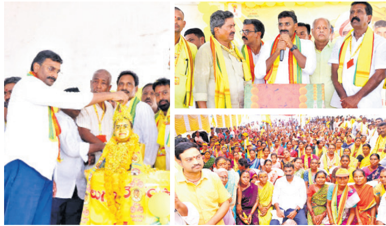
రాజాం (మనసులో మాట)

తెలుగుదేశం పార్టీ అధినేత, రాష్ట్ర ముఖ్యమంత్రి నారా చంద్రబాబు ఆదేశాలమేరకు, రెండవ రోజు హైబ్రిడ్ 'మహానాడు'