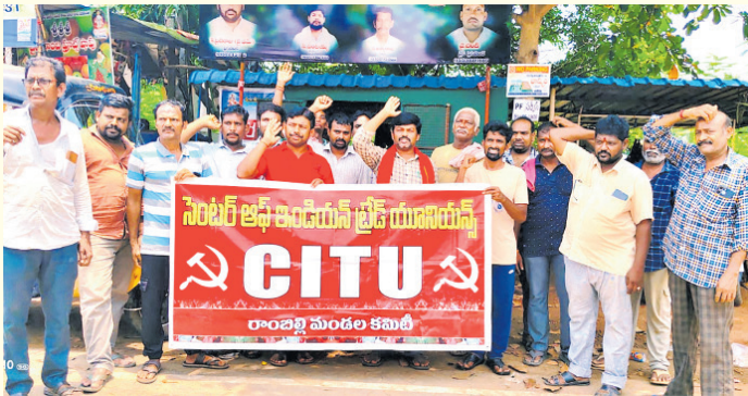
(రాంబిల్లి మే 28 మనసులో మాట)