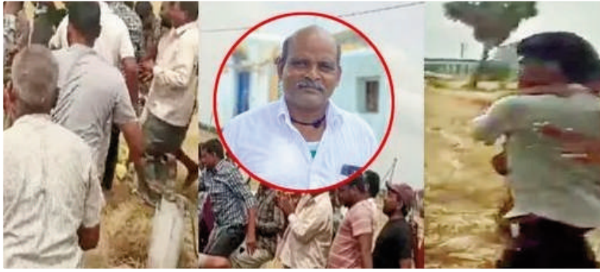
తలకిందులుగా ఇరుక్కుపోయిన తాత