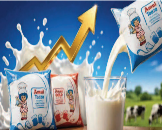
రూపాయలకు చేరుకుంది. పాల ధరల పెంపుకు అనేక కారణాలు ఉన్నాయని డైరీ సంస్థలు చెబుతున్నాయి. ముఖ్యంగా పశువుల దాణా ధరలు భారీగా పెరగడం ప్రధాన కారణంగా పేర్కొంటున్నాయి. గడ్డి, తవ్వు, ఇతర పశు ఆహార పదార్థాల ధరలు పెరగడంతో పాల ఉత్పత్తి వ్యయం గణనీయంగా పెరిగిందని సంస్థలు వెల్లడించాయి. అదేవిధంగా రవాణా ఖర్చులు కూడా పెరిగాయి. పెట్రోల్,

న్యూఢిల్లీ, మే 14: నిత్యవసర వస్తువుల ధరల పెరుగుదలతో ఇప్పటికే ఇబ్బందులు ఎదుర్కొంటున్న ప్రజలకు ప్రముఖ డైరీ సంస్థలు మరో షాక్ ఇచ్చాయి. దేశీయ ప్రముఖ పాల ఉత్పత్తుల సంస్థ అమూల్ పాలు ధరలను పెంచుతున్నట్లు ప్రకటించింది. అమూల్ బ్రాండ్ ఉత్పత్తులను మార్కెట్లోకి చేసే గుజరాత్ కోఆపరేటివ్ మిల్క్ మార్కెటింగ్ ఫెడరేషన్ అన్ని రకాల పాల ప్యాకెట్లపై లీటరుకు రెండు రూపాయల చొప్పున ధరలు పెంచింది. ఈ కొత్త ధరలు మే 14 నుంచి దేశవ్యాప్తంగా అమల్లోకి వచ్చాయి. ధరల పెంపుతో అరటిటర్ అమూల్ గోల్డ్, అమూల్ టాజా, అమూల్ శక్తి పాల ప్యాకెట్ల ధర ఒక్కో రూపాయి మేర పెరిగింది. లీటర్ అమూల్ గోల్డ్ పాలు ధర 68 రూపాయల నుంచి 70 రూపాయలకు చేరగా, అమూల్ టాజా ధర 55 రూపాయల నుంచి 57 రూపాయలకు పెరిగింది. అమూల్ బాటలోనే మరో ప్రముఖ డైరీ సంస్థ మదర్ డెయిరీ కూడా పాల ధరలను పెంచుతున్నట్లు ప్రకటించింది. ముఖ్యంగా ఢిల్లీ పరిసర ప్రాంతాలు, ఇతర నగరాల్లో లీటర్ పాలపై రెండు రూపాయల వరకు పెంపు అమలు చేస్తున్నట్లు వెల్లడించింది. గౌరీ పాలు ధర లీటరుకు 75 రూపాయల నుంచి 80 రూపాయలకు పెరగగా, ఫుల్ క్రీమ్ పాలు ధర 69 రూపాయల నుంచి 72