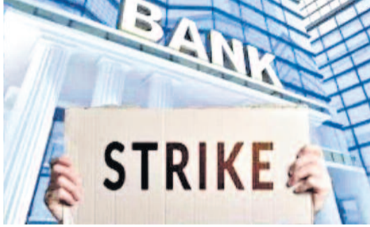
వంటి బాధ్యతల కారణంగా ఉద్యోగులపై ఒత్తిడి పెరుగుతోందని తెలిపింది. ఈ పరిస్థితుల్లో వారానికి ఐదు రోజుల పనివిధానం అమలు చేస్తే ఉద్యోగుల సామర్థ్యం మరింత మెరుగవుతుందని అభిప్రాయపడింది. అలాగే ఈ నిర్ణయం వల్ల దేశవ్యాప్తంగా లక్షలాది మంది బ్యాంకు ఉద్యోగుల ప్రయాణ భారం తగ్గుతుందని సంఘం పేర్కొంది. ఒక రోజు అదనపు నెలపు కారణంగా పెట్రోల్, డిజిల్ వినియోగం తగ్గడంతో పాటు ట్రాఫిక్ రద్దీ కూడా కొంత మేర

న్యూఢిల్లీ, మే 14: దేశవ్యాప్తంగా బ్యాంకింగ్ రంగంలో వారానికి ఐదు రోజుల పనిదినాల అమలుపై మరోసారి చర్చ ప్రారంభమైంది. బ్యాంకు ఉద్యోగ సంఘాలు చాలా కాలంగా చేస్తున్న ఈ డిమాండ్ను మళ్ళీ కేంద్ర ప్రభుత్వం ముందుకు తీసుకెళ్లాయి. వారానికి ఐదు రోజుల పని విధానాన్ని తక్షణమే అమలు చేయాలని కోరుతూ బ్యాంకింగ్ ఉద్యోగ సంఘాలు ప్రధాని నరేంద్ర మోదీకు లేఖ రాశాయి. దేశవ్యాప్తంగా బ్యాంకు అధికారులను ప్రాతినిధ్యం వహిస్తున్న అల్ ఇండియా బ్యాంక్ అఫీసర్స్ కాన్ఫెడరేషన్ ఈ మేరకు కేంద్ర ప్రభుత్వానికి వినతిపత్రం సమర్పించింది. ఐదు రోజుల పనిదినాల అమలు కేవలం ఉద్యోగుల సేవా నిబంధనలకు సంబంధించిన అంశం మాత్రమే కాదని, ఇది ఇంధన పరిరక్షణ, పర్యావరణ సంరక్షణ, శక్తి వినియోగ తగ్గింపు, కార్యనిర్వహణ సామర్థ్యం వంటి అనేక ప్రయోజనాలకు దోహదపడుతుందని సంఘం పేర్కొంది. ప్రస్తుతం బ్యాంకు ఉద్యోగులు భారీ పని ఒత్తిడిలో పనిచేస్తున్నారని సంఘం వెల్లడించింది. శాఖ నిర్వహణ, నగదు లావాదేవీలు, వినియోగదారుల సేవలు, రుణ పనులు ప్రభుత్వ పథకాల అమలు, గ్రామీణ ఆర్థిక సేవ విస్తరణ