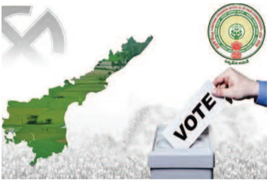
ఓటర్ల జాబితా సవరణకు ఆదేశం

సాధించాలని లక్ష్యంగా పెట్టుకుంది. ఇందుకోసం ఇప్పటికే నియోజకవర్గాల ఇన్ ఛార్జులు, ఎమ్మెల్యేలకు ముఖ్యమంత్రి చంద్రబాబు నాయుడు స్వయంగా పంపారు. గత వైసీపీ ప్రభుత్వ హయాంలో అనుసరించిన ఎన్నికల వ్యూహాలనే కూటమి కూడా పాటిస్తే, అత్యధిక పంచాయతీలు, మున్సిపాలిటీలు తమ భాషాలోకి వస్తాయని నేతలు అంచనా వేస్తున్నారు. మరోవైపు, ప్రస్తుత పరిణామాల నేపథ్యంలో పోటీకి దిగాలా వద్దా అన్న సందేహంలో ప్రధాన ప్రతిపక్షం వైసీపీ ఉన్నట్లు తెలుస్తోంది. స్థానిక ఎన్నికల నిర్వహణలో రిజర్వేషన్ల ప్రక్రియ ఎప్పుడూ పెద్ద సవాలుగా మారుతోంది. ఇంతలో టీసీ గణాంకాల విషయంలో తర్రతైన న్యాయపరమైన ఇబ్బందులను దృష్టిలో ఉంచుకుని, ఈసారి 'ఏకీకృత కూటమి సర్వే' ఆధారంగా రిజర్వేషన్ల ఖరారు చేయాలని ప్రభుత్వం యోచిస్తోంది. ఈ సర్వేలో సామాజిక వర్గాల వారీగా స్వచ్ఛమైన గణాంకాలు ఉండటంతో దీనిని ప్రామాణికంగా తీసుకోవాలని భావిస్తున్నారు. అయితే, సుప్రీంకోర్టు ఆదేశించిన 'ట్రీపుల్ బెస్ట్' నిబంధనలను పాటించడం ద్వారా న్యాయపరమైన చిక్కులు రాకుండా చూడాలని ప్రభుత్వం భావిస్తోంది.