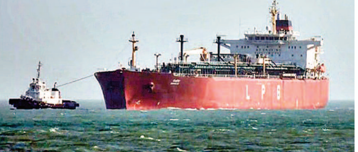
ముడిచమురు, వంటగ్యాస్ సరఫరాలో కూడా ఈ మార్గం అత్యంత ప్రాధాన్యత కలిగి ఉంది. అందువల్ల ఈ ప్రాంతంలో ఉద్రిక్తతలు పెరిగిన ప్రతిసారి ప్రపంచ ఇంధన మార్కెట్పై ప్రభావం పడుతుంది. ఇటీవల అమెరికా, ఇరాన్ మధ్య పరిస్థితులు మరింత ఉద్రిక్తంగా మారాయి. ఇరాన్తో కాల్పుల విరమణ చర్చలు క్లిష్ట పరిస్థితుల్లో ఉన్నాయని అమెరికా అధ్యక్షుడు డొనాల్డ్ ట్రంప్ వ్యాఖ్యానించారు. అమెరికా ప్రతిపాదించిన శాంతి ఒప్పందంపై ఇరాన్ స్పందన పూర్తిగా సంతృప్తికరంగా లేదని ఆయన తన సామాజిక మాధ్యమ వేదికలో పేర్కొన్నారు. పాకిస్తాన్

న్యూఢిల్లీ, మే 14: అమెరికా-ఇరాన్ మధ్య ఉద్రిక్త పరిస్థితులు కొనసాగుతున్నప్పటికీ భారత్కు వంటగ్యాస్ సరఫరాలో కీలకమైన పరిణామం చోటుచేసుకుంది. పర్షియన్ గల్ఫ్ ప్రాంతం నుంచి భారత్కు ఎల్పీజీ తీసుకువస్తున్న రెండు నౌకలు వ్యూహాత్మకంగా అత్యంత కీలకమైన హార్వాజ్ జలసంధిని విజయవంతంగా దాటాయి. దీంతో ప్రపంచ ఇంధన రవాణాలో కీలకమైన ఈ సముద్ర మార్గంలో సరఫరాలు మళ్ళీ క్రమంగా సాధారణ స్థితికి చేరుతున్నాయనే సంతోషాలు కనిపిస్తున్నాయి. సమాచారం ప్రకారం 'సిమి' పేరుతో ప్రయాణిస్తున్న ఎల్పీజీ నౌక గురువారం ఒమన్ గల్ఫ్ ప్రాంతంలోకి ప్రవేశించింది. ఖతార్లోని రాస్ లఫాన్ పోర్టు నుంచి బయలుదేరిన ఈ నౌక గుజరాత్లోని కాండ్లా పోర్టుకు వస్తోంది. ప్రయాణ సమయంలో భద్రతా కారణాల దృష్ట్యా ఈ నౌక తన ట్రాన్స్పాండర్ సంతకాలను తాత్కాలికంగా నిలిపివేసినట్లు అంతర్జాతీయ నౌకాశ్రయ వర్గాలు తెలిపాయి. ఇక యు.ఎస్.ఎస్.ఆర్. అరబ్ ఎమిరేట్స్లోని రువాయిలి రిఫైనరీ నుంచి బయలుదేరిన 'ఎస్సీ సన్షైన్' అనే మరో వంటగ్యాస్ నౌక కూడా హార్వాజ్ జలసంధిని దాటి భారత జలాల దిశగా ప్రయాణిస్తోంది. ఈ నౌక కర్ణాటకలోని మంగళూరు పోర్టుకు చేరుకోనున్నట్లు సమాచారం. ఈ నౌక కూడా జలసంధి దాటిన అనంతరం తన సిగ్నల్ వ్యవస్థను నిలిపివేసినట్లు తెలుస్తోంది. ప్రపంచ ముడిచమురు, ద్రవిభవించిన సహజ వాయువు రవాణాలో హార్వాజ్ జలసంధి అత్యంత కీలక పాత్ర పోషిస్తుంది. మధ్యప్రాచ్య దేశాల నుంచి ఆసియా దేశాలకు వెళ్లే ఇంధన సరఫరాలో పెద్ద భాగం ఈ సముద్ర మార్గం ద్వారానే సాగుతుంది. భారత్కు అవసరమైన