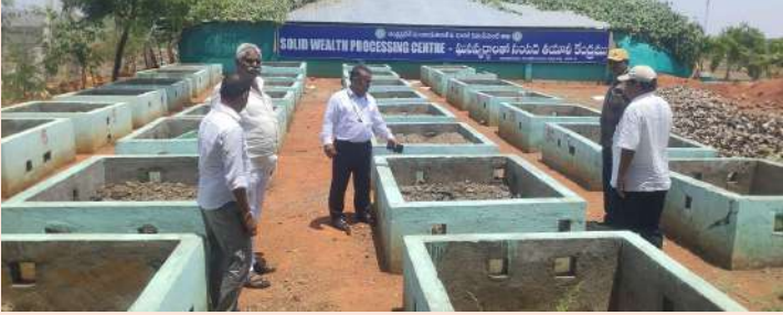
కారంపూడి, జూన్ 3 (పల్నాడు జిల్లా) మనసులో మాట :-

నిధుల కొరతతో కొట్టుమిట్టాడుతున్న గ్రామ పంచాయతీలకు స్వయంగా ఆదాయ వనరులు సమకూర్చుకునే విధంగా రాష్ట్ర ప్రభుత్వం ప్రవేశపెట్టిన తడి, పొడి చెత్త నుండి ఆదాయం పొందవచ్చునన్ను చేసిన ఆలోచనకు పర్యావసానమే చెత్త నుండి ఆదాయ వనరులు. పారిశుధ్య నిర్వహణ అనేది గ్రామపంచాయతీల ప్రాథమిక బాధ్యత అయితే, పారిశుధ్య నిర్వహణ ద్వారా సంపద సృష్టించడం అనేది గ్రామపంచాయతీల చరిత్రలో నూతన అధ్యాయంగా మారనుంది. మనం రోజు గృహ అవసరాల తర్వాత పారేసే చెత్తతో వివిధ రకాల పద్ధతిలో ఆదాయాన్ని సమకూర్చుకోవచ్చని చేస్తున్న ప్రయత్నమే ఈ చెత్త నుండి సంపద సృష్టి. ఆంధ్రప్రదేశ్ ప్రభుత్వం ఘన వ్యర్థాల నిర్వహణ విధానంలో అత్యంత ఆధునిక పోకడలతో అమలు చేస్తూ భారతదేశ స్థాయిలో విశిష్ట గుర్తింపు పొందింది. తొలుత జిల్లాకు పది పంచాయతీలను ఎంపిక చేసి మోడల్ పంచాయతీలుగా తీర్చిదిద్ది, ఆ తర్వాత ఆంధ్ర ప్రదేశ్ అన్ని పంచాయతీలలో చేపట్టాలని లక్ష్యంగా పెట్టుకోవడం జరిగింది. ఘన వ్యర్థాల నిర్వహణ కొరకు సాలిడ్ వ్రాస్ సెంటర్ పేరుతో పెద్దను నిర్మించుకొని వాటికి అవసరమైన సౌకర్యాలను సమకూర్చుకొంటున్నారు. ఇంకా ఉపాధి హామీ