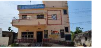
విచలవిధిగా ఎన్ఓసీలు ఇస్తున్న పంచాయతీ సెక్టరి చల్లారెడ్డిపాలెం పంచాయతీ

అక్రమ మద్యం విక్రయాలు జరుగుతున్నాయనే ఫిర్యాదులు గతంలో అధికారుల దృష్టికి తీసుకెళ్లినప్పటికీ తగిన చర్యలు కనిపించలేదని స్థానికులు పేర్కొంటున్నారు. దీంతో కాలనీలో అసాంఘిక కార్యక్రమాలు పెరుగుతున్నాయనే ఆందోళన వ్యక్తమవుతోంది.