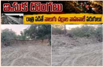
ఇసుక దొంగలు రాత్రి పడితే నాలుగు చక్రాల వాహనాలే ఏరుగులు!