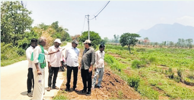
పాలకొండ, జూన్ 2, మనసులో మాట: