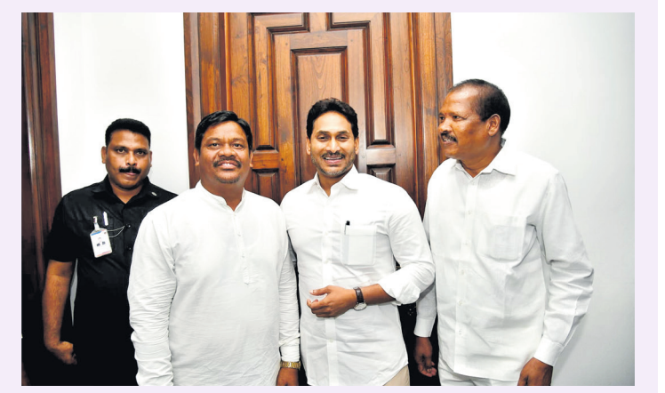
యోజకవర్గ అభివృద్ధికి, ప్రజల పక్షాన పో అందిస్తామని హామీ ఇచ్చినట్లు ఎమ్మెల్యే రాడటానికి తన వంతు పూర్తి సహకారం తెలిపారు